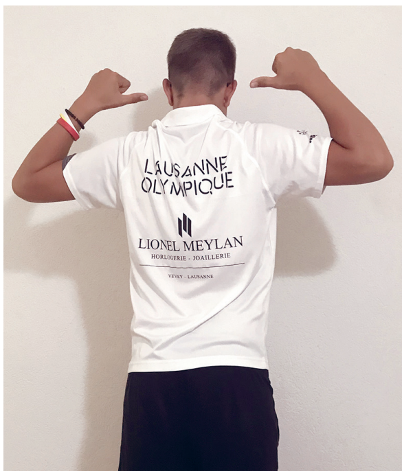
Équipements avec votre logo

Nous sommes actuellement sponsorisés par Lionel Meylan Horlogerie-joaillerie.