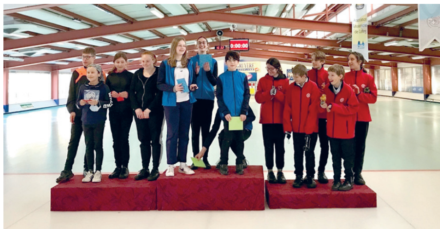
Troisième place au championnat de la relève, région ouest