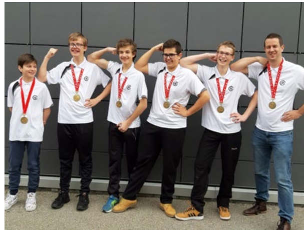
Médaille de bronze ligue nationale C, saison 2019-2020

Puis, nous avons participé pour la première fois aux qualifications de la ligue nationale C en nous qualifiant dès la 1 ère année pour la finale du championnat suisse ; nous avons terminé à la 6 ème place sur 28 au printemps 2019 et en sommes très fiers.