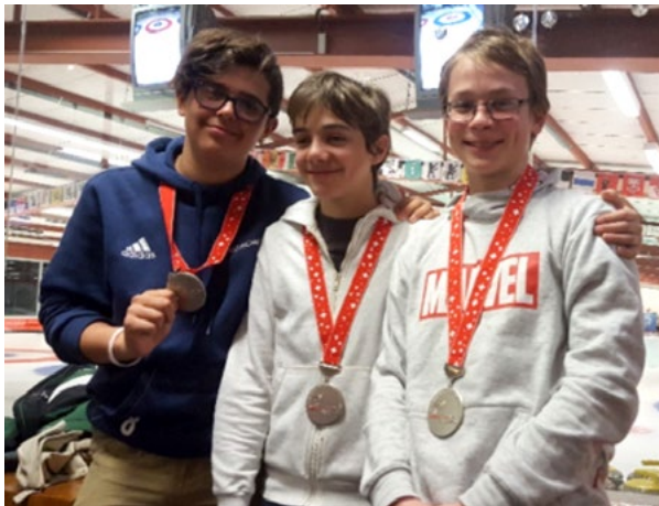
Médaille d'argent aux championnats suisses Cherry Rockers

Très rapidement, nous avons eu la chance d'être confrontés à des compétitions de niveau national. Nous avons obtenu la médaille d'argent aux championnats suisses Cherry Rockers en 2018 (petites pierres de 10 kg).